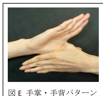
図E 手掌・手背パターン