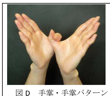
図D 手掌・手掌パターン