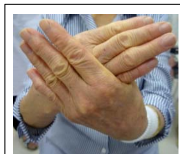
図C 手掌・手背パターンですが、形が違うので×